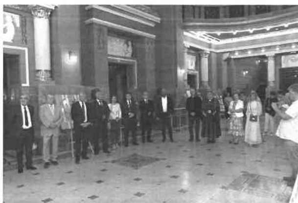
Expoziție în foaiorul Palatului Cultural, alături de partenerii din Pécs, Ungaria

Ghidare grup turiști din Africa de Sud, Ungaria, Germania, Polonia.