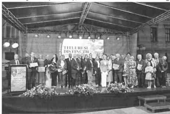
Titluri și distincții la Zilele Aradului