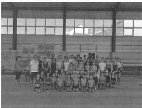
Echipele partenere la Clubul Gloria Arad