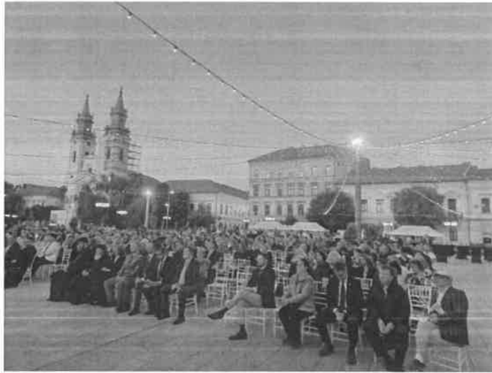
Oficialitățile, alături de delegațiile autohtone și străine la Ședința festivă din cadrul Zilelor Aradului