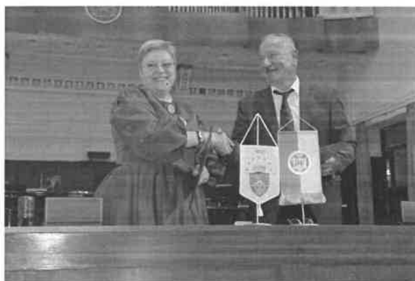
Semnarea Acordului de colaborare între Universitatea de Vest Vasile Goldiș Arad și Universitatea din Pécs